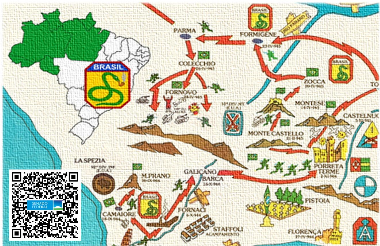
Imagem. Teatro de Operações Italiano (1944 e 1945). O QR Code acima dá acesso à Moção de Aplauso do Senado Federal (RQS 726/2022) relacionada aos Pracinhas da Amazônia.