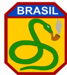
Imagem. Layout da placa de aço Inox para o Quartel do 2º BIS alusiva ao Monumento Febiano existente naquela OM, bem como os 180 anos de sua fundação no Bicentenário da Independência

Após as apresentações, dialogamos sobre o layout da placa inox a ser doada ao 2º BIS tendo em vista o monumento aos Pracinhas da Amazônia que o Cel Landim havia nos informado que desejava restaurar para reinauguração