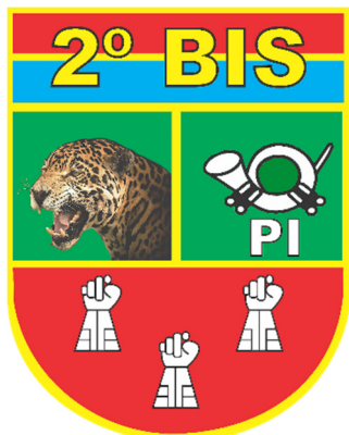
2º Batalhão de Infantaria de Selva