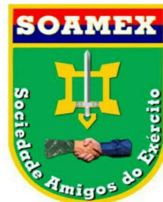
Sociedade Amigos do Exército - Belém/PA