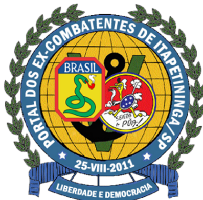
Portal dos Ex-Combatentes de Itapetininga/SP