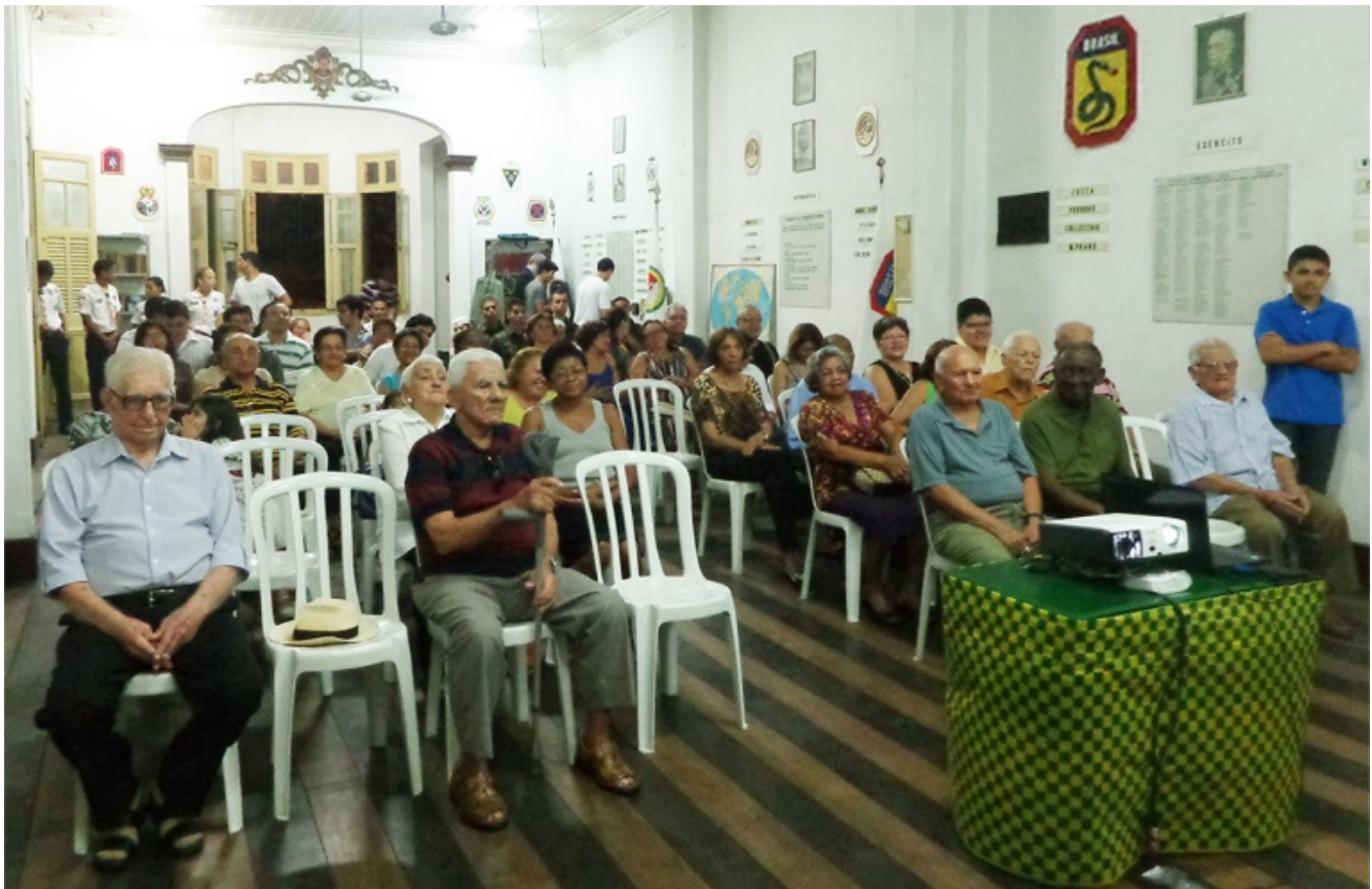
Reunião de Ex-combatentes e familiares no Salão Nobre da AECB-PA em janeiro de 2013.

Porém, como haviam feito no duríssimo frio italiano, sob condições de combate extremamente adversas, eles resistiram, se organizaram, criaram as Associações de Ex-Combatentes, como a AECB-RJ, a primeira, ainda em 1945, e a AECB-PA (1946), e iniciaram uma nova batalha “morro acima”, como em Monte Castelo, desta vez em solo pátrio, pelo reconhecimento de seus direitos e sua história. Grande parte dessas histórias de vida e luta só começaram a vir à tona muitas décadas após o fim da campanha da FEB.